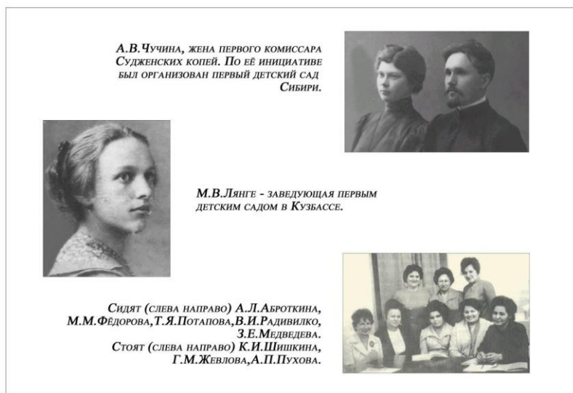
Организаторы дошкольного воспитания в Кузбассе.

До 1920 года в Сибири все еще продолжалась гражданская война, но несмотря на огромные трудности этого периода, Сибирский революционный комитет принял ряд действенных мер по реализации директив партии и правительства. Уже в начале 1920 года в СибОНО в губерниях и уездах были созданы отделы по дошкольному воспитанию, которые развернули большую работу по привлечению женщин к организации сети дошкольных учреждений. В сведениях СибОНО по Щегловскому уезду (Кемеровская область) сообщалось, что за дошкольным отделом числится 8 приютов (учреждений для воспитания сирот и беспризорных детей).