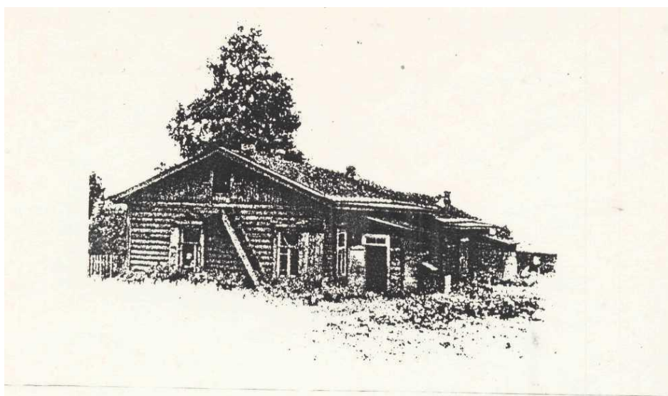
Так выглядел первый детский сад Сибири (1918 г.)

Первые ясли для грудных, детей были открыты в Петербурге в 1845 году, фабричные ясли впервые возникли при Раменской текстильной фабрике (Московская губерния) в 1880 году. По примеру Москвы и Петербурга ясли-приюты для детей преддошкольного и дошкольного возраста стали открываться на средства частных благотворительных и филантропических обществ в других промышленных центрах России.